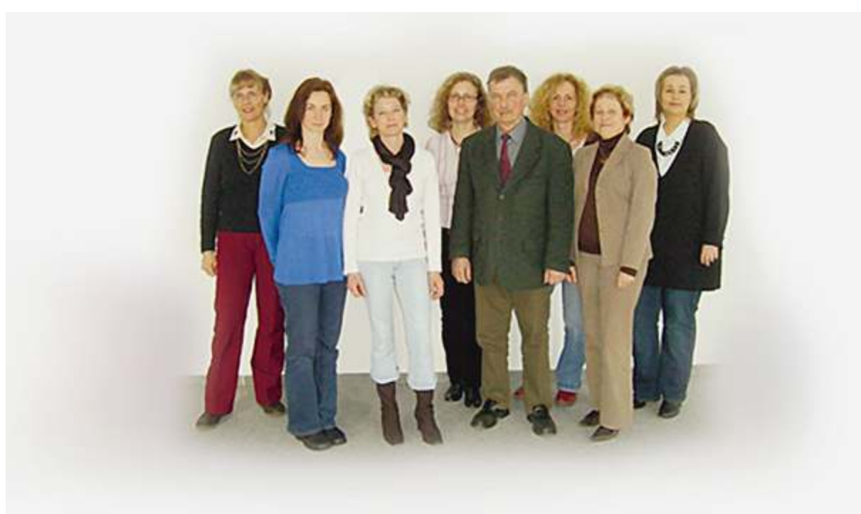
Das Team der Volkshochschule 2009.