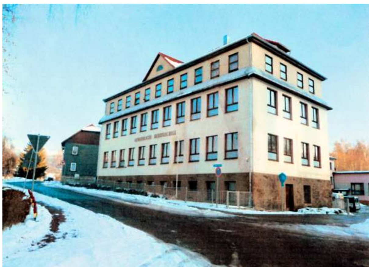
Hier im Gebäude der ehemaligen Gewerbeschule hat die Außenstelle Zella-Mehlis der Volkshochschule ihr Domizil.